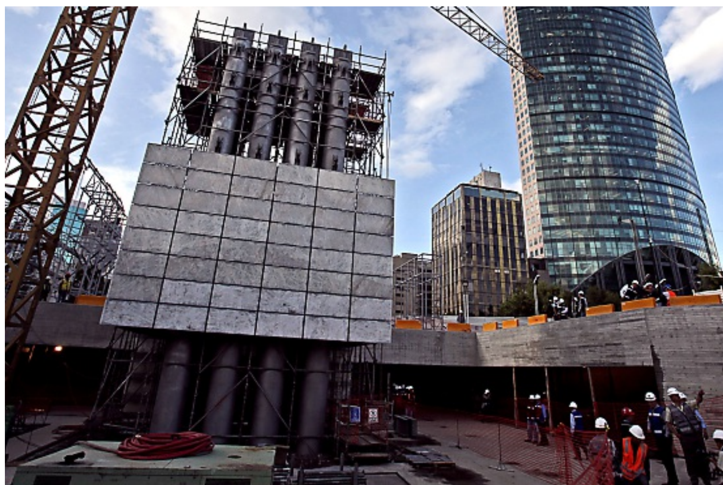
Los primeros 25 metros de cuarzo y acero están en pie, faltan cuatro segmentos para completar la Estela, de 104 metros desde el nivel de la calle.

Una copia idéntica de la bula Inter Cetera II se encuentra en Sevilla, España, pero carece del sumario.